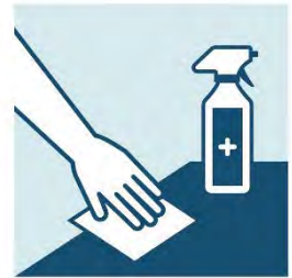
물건과 표면을 깨끗하게 유지하기

증상이 심해지면 담당의에게 다시 전화하십시오. 호흡이 어려울 경우에도 다시 전화하십시오. 의사의 지시를 따르십시오.