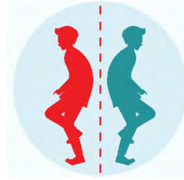
다른 사람과의 접촉 피하기